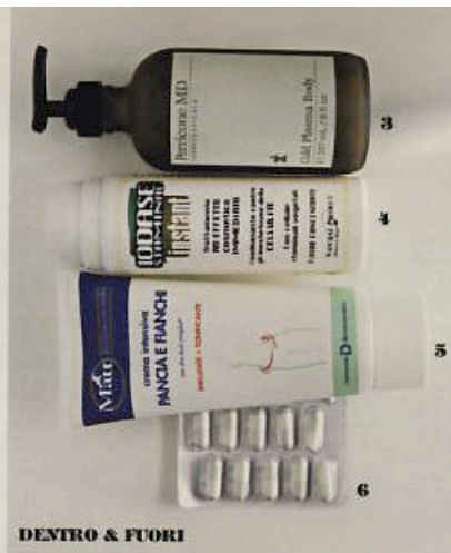
DENTRO & FUORI

IL TRUCCO PER MANTENERE I PROPOSITI “FORMA” DI INIZIO ANNO? OBIETTIVI POSSIBILI, DA PERSEGUIRE CON COSTANZA